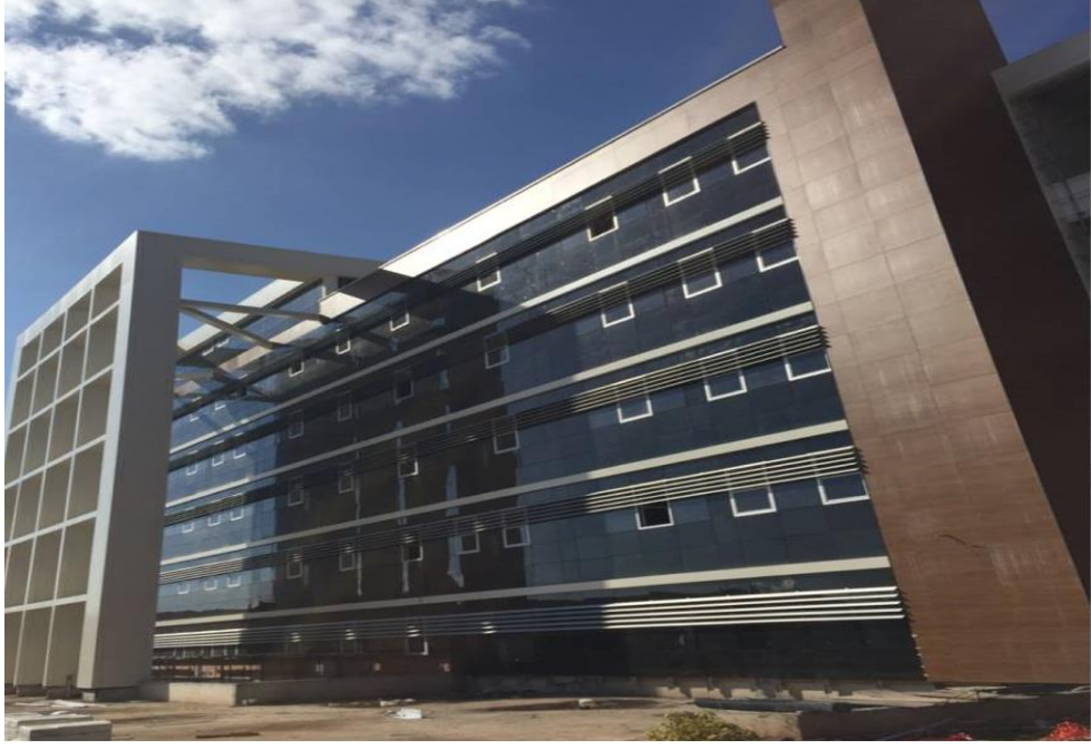
Diş Hekimliği Fakültesi